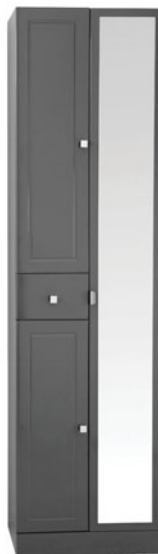
Colonne L.50 cm