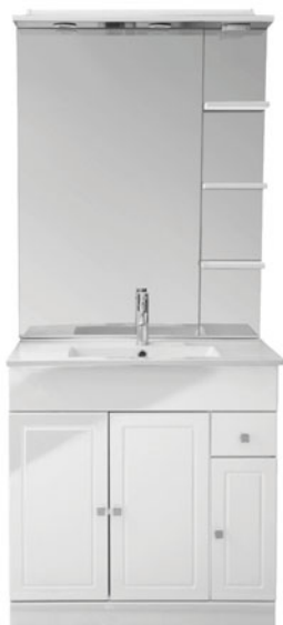
Meuble L.80 cm