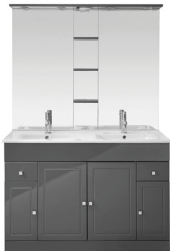
Meuble L.120 cm